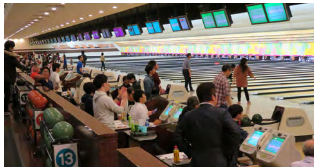
2019年度のボウリング大会風景

現在、一昨年開催し好評を得たボウリング大会を計画中(2022年2月5日(土)を予定)です。具体化次第、募集案内しますので、多くの皆様のご参加をお待ちしております。