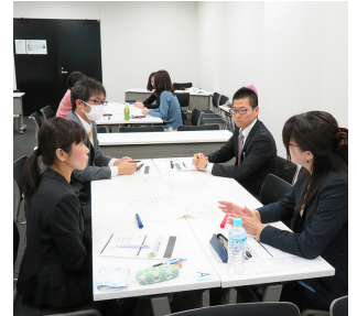
わかりやすく具体的な指導が好評