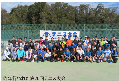
昨年行われた第20回テニス大会

新年度も時代の変化に対応したスポーツイベント、保険事業を展開したいと考えています。