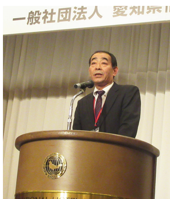
一般社団法人 愛知宗

詳細は⇒ www.aia.or.jp/event/gashi2019_top.html