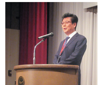
締め挨拶をする富板AiA副会長

AiAは、一般社団法人 愛知県情報サービス産業協会 (Aichi Information Service Industry Association) の略称です。本会は、情報サービス産業に係る事業の基盤整備、情報関連技術の開発促進等を行うことにより、愛知県内の情報サービス産業の健全な発展を図るとともに、情報化を促進し、もって地域経済の発展に寄与することを目的としています。