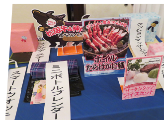
お楽しみ抽選会の賞品