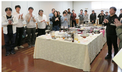
ゲーム終了後には懇親パーティも行われた

今回参加したのは11社37名で、2ゲームを行いました。腕に自信のある人、ボウリングは久しぶりだという人、初心者と、様々なメンバーが入り混じる中での戦いでしたが、皆大いに楽しんでようです。大会の順位は次の通りです。