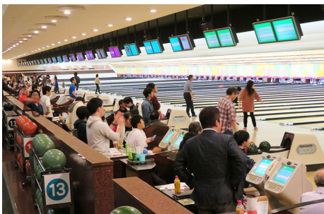
ストライクに大きな歓声が飛び、大いに盛り上がった

2月1日(土)、星が丘ボウル(名古屋市千種区)で、2019年度 AiAボウリング大会を行いました。