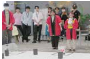
お揃いの法被で参加