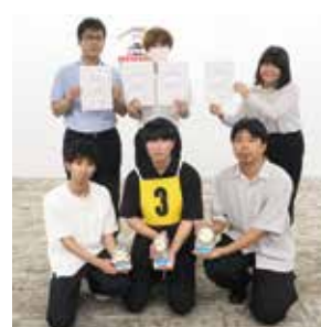
4つの賞を獲得したHabitageチーム