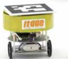
力走するHabitageチームのロボット