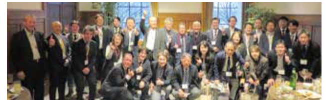
和やかな雰囲気の中で行われた懇親会

参加者からは、「多くの企業と交流でき、ビジネス上の多くのヒントを得た」「会話が盛り上がり、飲食時間の確保が難しいくらいであった」との声が聞かれました。