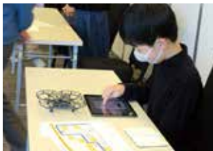
タブレットでドローンに命令

今回の開催にあたり、委員企業であるシンポー情報システム(株)および日鉄ソリューションズ中部(株)から、機材や運営ノウハウの提供を受けました。